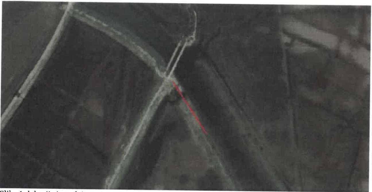
Slika 1: lokacija izgradnje nasipa

jarku. Precizna kota će se odrediti prilikom izvođenja radova.